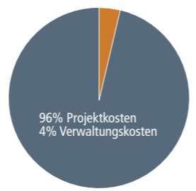
Grafik: Stand 2010

Ihre Unterstützung wird direkt in Hilfe vor Ort umgesetzt! Ehrenamtlichkeit zahlt sich aus: Die Verwaltungskosten von PROJECT-E betragen nur 4%! 96% der Mittel fließen unmittelbar in das Projekt. Ihr Geld kommt also genau dort an, wo es gebraucht wird. Unterstützen Sie PROJECT-E und geben Sie einem Waisenkinder die Chance, ihre Armut aus eigener Kraft zu überwinden!